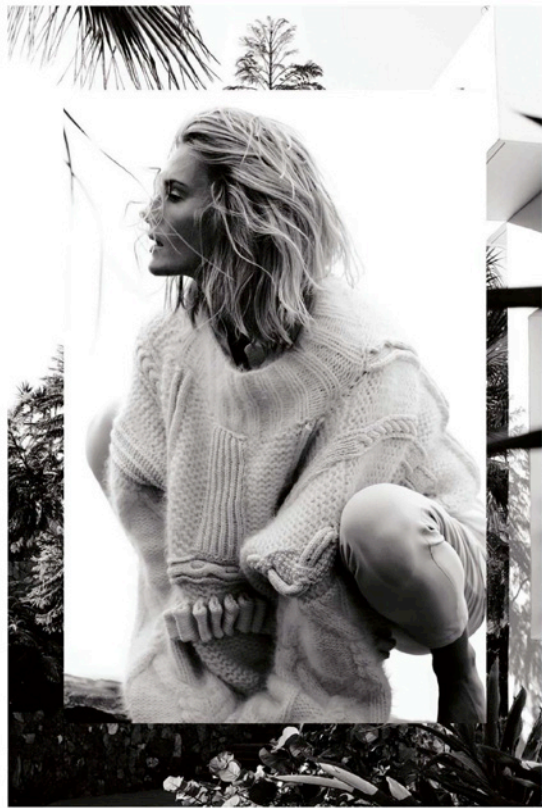
TRUI, TUINCH LEGGING, WOOLRICH